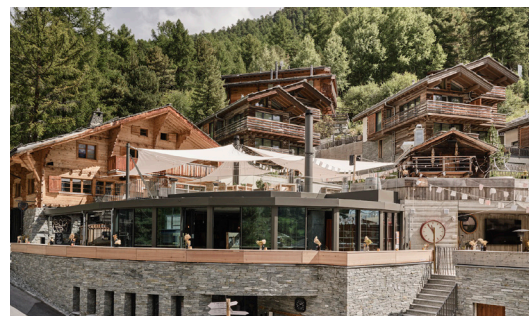
Complexe hôtelier Zermatt VS 5 x Opticalor eau-eau (10 kW) 1 x Opticalor saumure-eau (152 kW) 2 x Opticalor eau-eau (32 kW) 1 x Opticalor eau-eau (10 kW)