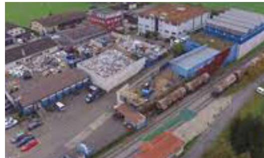
Bâtiment industriel Buron LU Opticalor air-eau (23 kW)