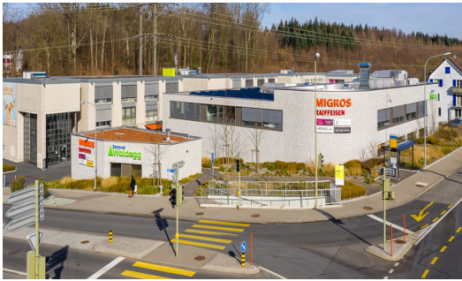
Centre commercial Waldegg ZH Opticalor saumure-eau (98 kW)