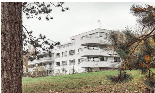
Immeuble d'habitation St. Gallen