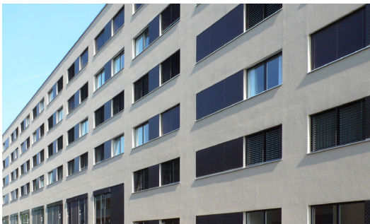
Immeuble d'habitation Zurich