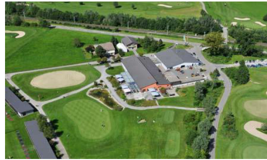
Terrain de golf Waldkirch ZH 3 x Opticalor air-eau (47 kW) 1 x Opticalor eau-eau (32 kW)