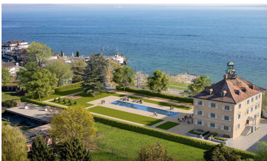
Château Horn TG Opticalor saumure-eau (22 kW)