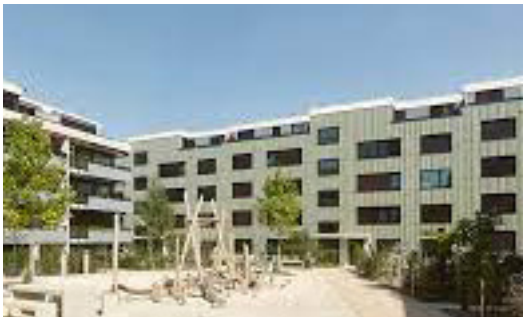
Immeuble d'habitation Zurich