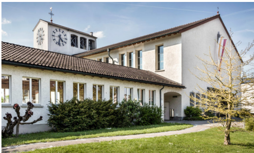
Église Lucerne Opticalor saumure-eau (73 kW)