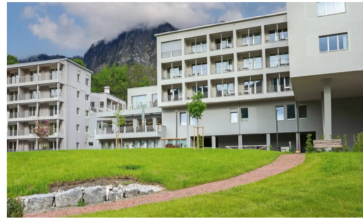
Maison de retraite Zizers GR