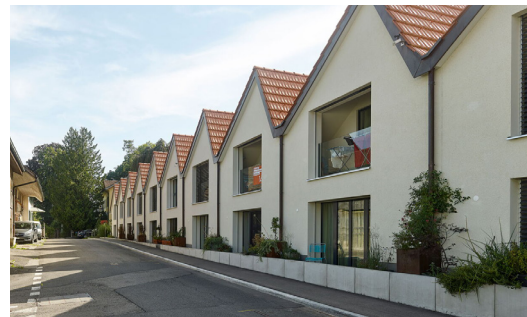
Immeuble d'habitation Birrwil AG