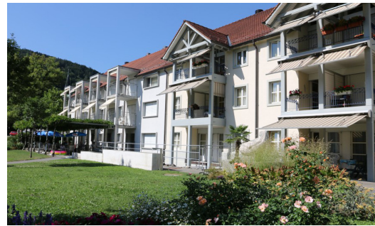
Maison de retraite Berneck SG