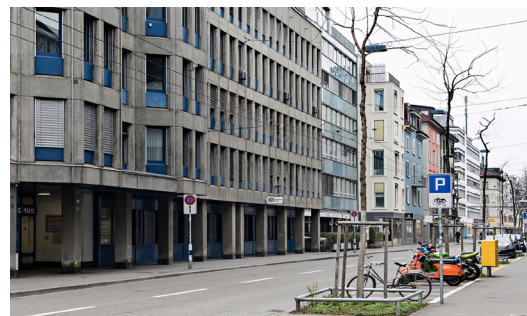
Immeuble d'habitation et de commercial Zurich