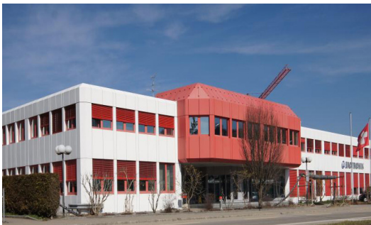
Bâtiment commercial Bulach ZH Opticalor eau-eau (32 kW)