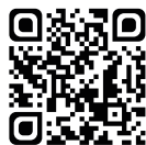
MURAO MULTI NOIR