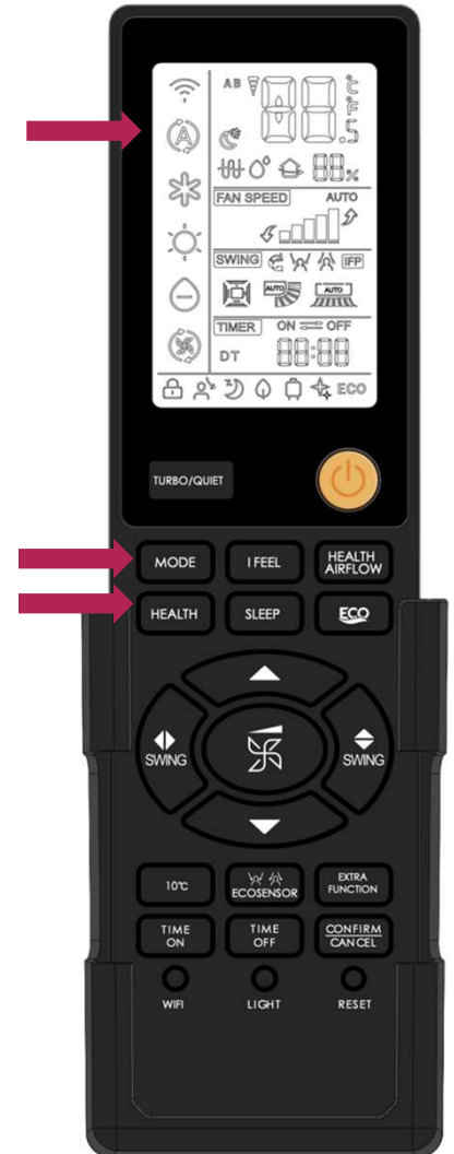
Murao Smart et Premium

Sélectionner le Mode Auto , puis appuyer 6 fois sur le bouton « HEALTH » en moins de 5 secondes. Pour l'activer : 4 bips Pour le désactiver : 2 bips