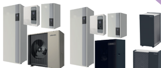
Alfea Excellia M Alfea Extensa M