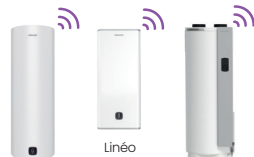
Aquéo Linéo Aquacosy Evolution