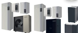
Alfea Excellia M Alfea Extensa M Alfea M Xtra M