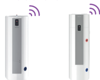
Calypso Split inverter Calypso Socle