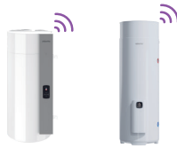
Calypso Mural CC Egéo