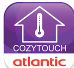
Application Atlantic Cozytouch

* Économies d'énergie primaire en kWh par an, pour le chauffage et l'eau chaude sanitaire : de 20 % à 30 % pour une chaudière THPE au gaz, en fonction de l'ancienneté de la chaudière remplacée, quelle que soit l'énergie d'origine. Source : ADEME (Le saviez-vous ? - Ademe)